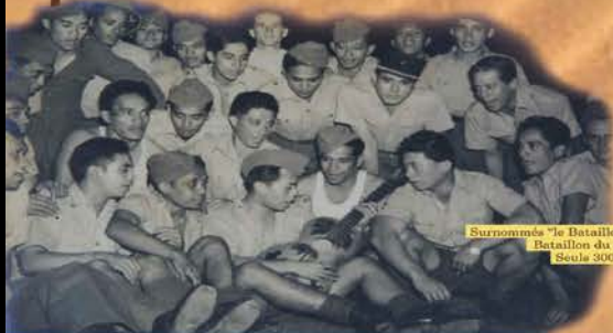
Surnommés « le Bataillon des guitaristes », les 600 volontaires du Bataillon du Pacifique ont mené de rudes batailles. Seuls 300 d'entre eux ont survécu.