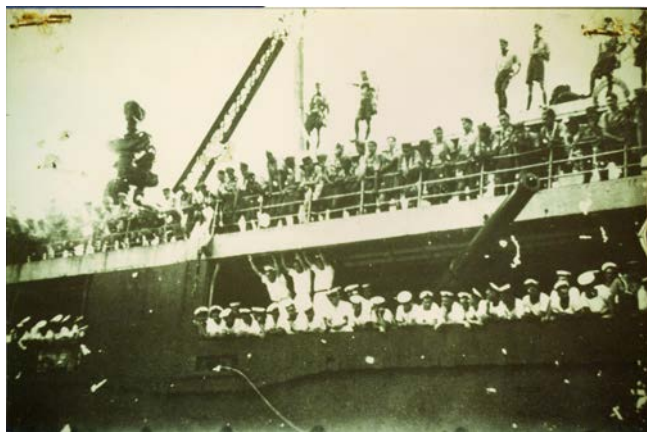
Port de Papeete – 21 avril 1941

Dès l'annonce de l'armistice signé par le Maréchal Pétain et dès l'Appel du 18 juin 1940, les Polynésiens ont manifesté avec force et détermination leur volonté d'aller se battre pour aider la France à se relever.