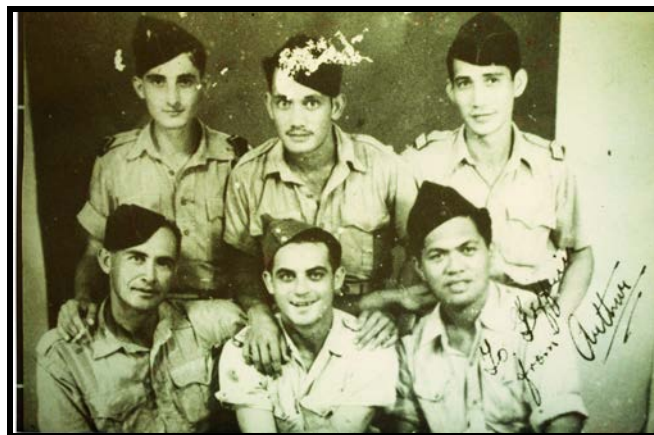
Photos souvenirs des anciens combattants polynésiens du Bataillon du Pacifique